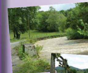
(La Gouarège en crue juin 2013)

Parfois, un simple orage peut générer une inondation localisée. Le débouchage des grilles d'absorption des eaux pluviales qui s'encroûtent de feuilles et de branches au moment de l'averse peut parfois suffire à prévenir.